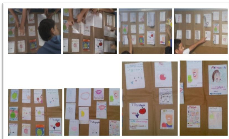
Figura 4. Exposição mural da escola

Para realizar a avaliação da aprendizagem dos conteúdos desenvolvidos utilizamos como ferramentas: (1) a atuação dos alunos durante as aulas, (2) a devolutiva dos alunos sobre o mastigar no dia a dia e (3) o registro das atividades vivenciadas em cada aula através da exposição no mural da escola. (Figura 4).