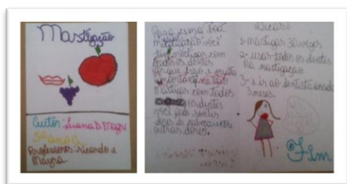
Figura 2. Folheto aluna 1

Na quarta aula incentivou-se que cada aluno (a) elaborasse individualmente um portador textual - folheto informativo. Foi então distribuída aos alunos (as) meia folha de sulfite e orientados (as) que: (1) dobrassem a folha ao meio formando uma capa, página 1, 2 e 3; (2) criassem um slogan , uma imagem que remetesse ao tema mastigação para criar a capa; em seguida foram redigidos nas páginas 1 e 2 textos na forma de dicas para uma correta mastigação, assim como também o uso de desenhos para reforçar o texto escrito. A página 3 foi propositalmente deixada em branco, pois posteriormente foi colada a folha de papel pardo para a exposição. Após uma leitura prévia realizamos a exposição dos folhetos nos murais da escola. (Figura 2 e 3)