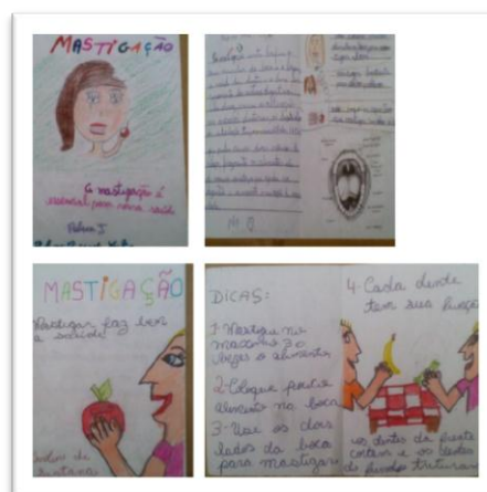
Figura 3. Folheto alunos 2 e 3