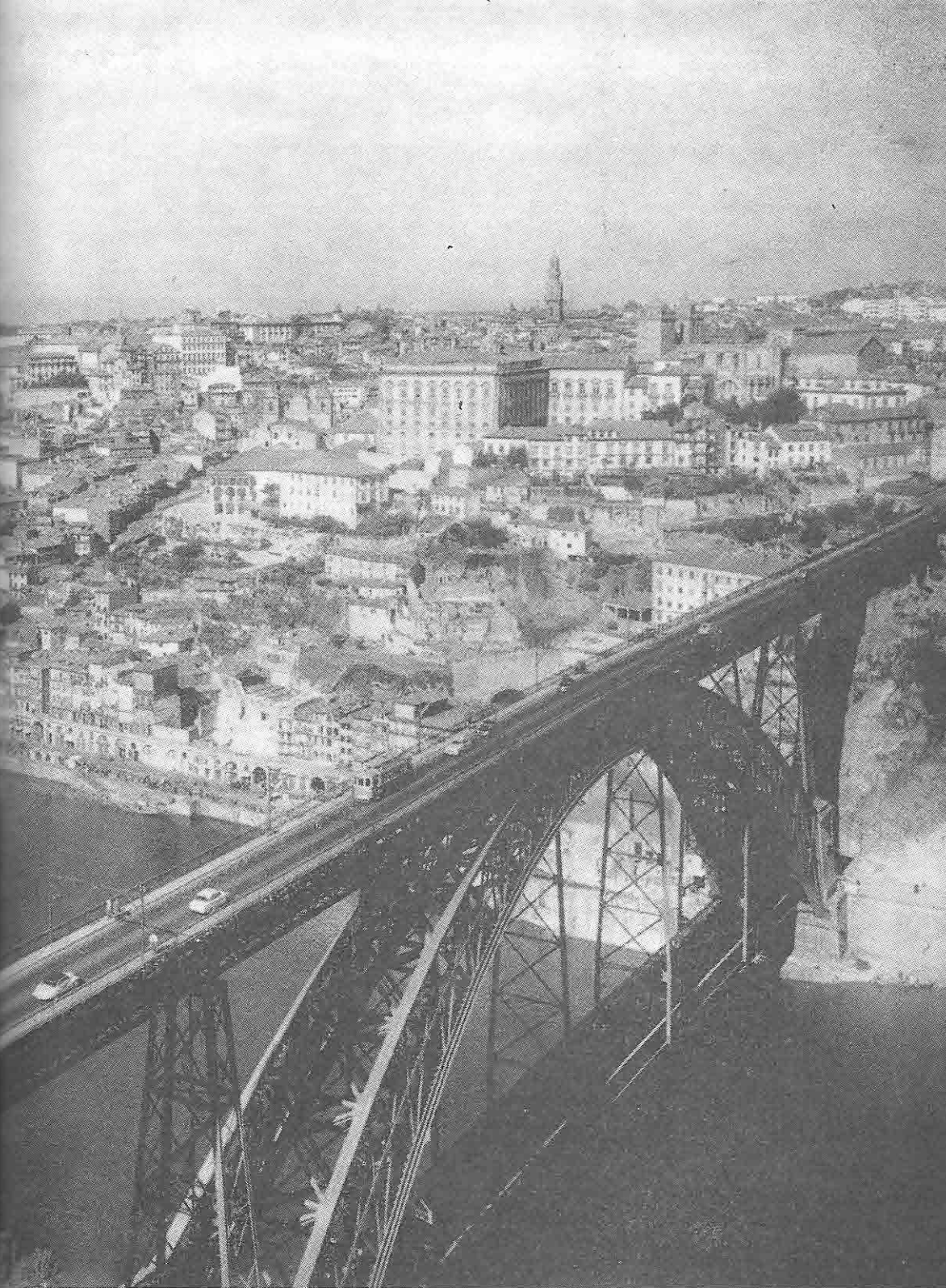
The city of Oporto , the second in Portugal , is built in amphitheater and overlooks the river Douro