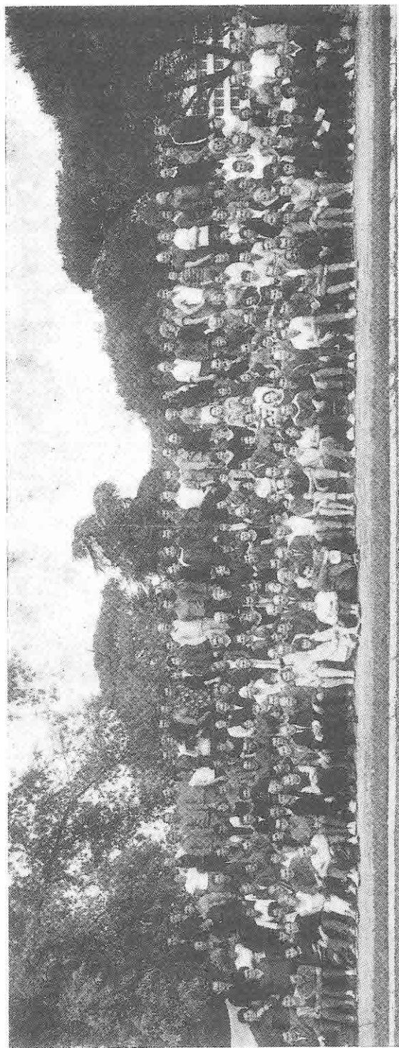
L'importance du Stage International du C. R. E. P. S. de l'Académie de Bordeaux est montrée aussi par le grand nombre des participants The importance of the International Course in the C. R. E. P. S. of the Bordeaux Academy is also shown by the great number of participants