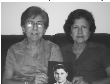
Tiene duas hijas

MUERE EN LIMA el 11 DE MARZO DE 1986, faltando 3 días para cumplir 75 años de edad.