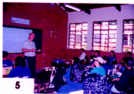
Curso: Educación Física Infantil Prof. Rodolfo Buenaventura