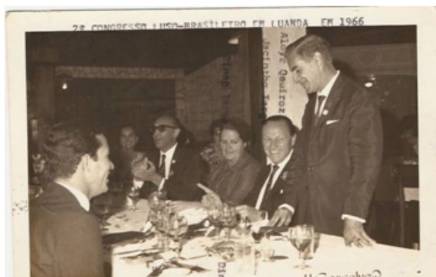
Em 1966 vários professores brasileiros participam do Congresso Luso-Brasileiro em Luanda, inclusive com apresentação de diversos trabalhos científicos.

Ser Delegado da FIEP é uma conquista pelo trabalho em seu Estado, passa a fazer parte dessa grande